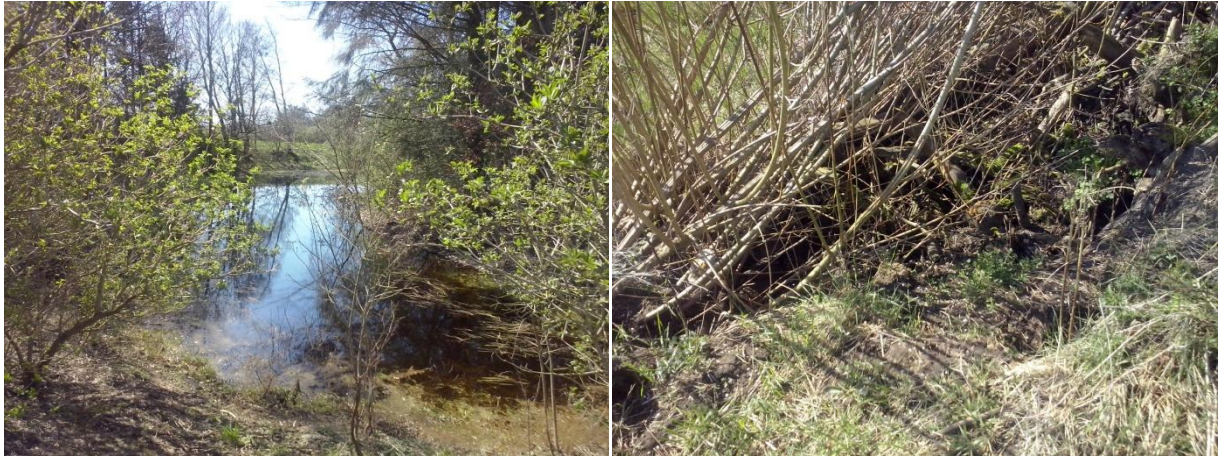
Figur 2: Mark 13-0 - Til venstre ses søen og til højre ses væltede træer over et mindre vandhul.