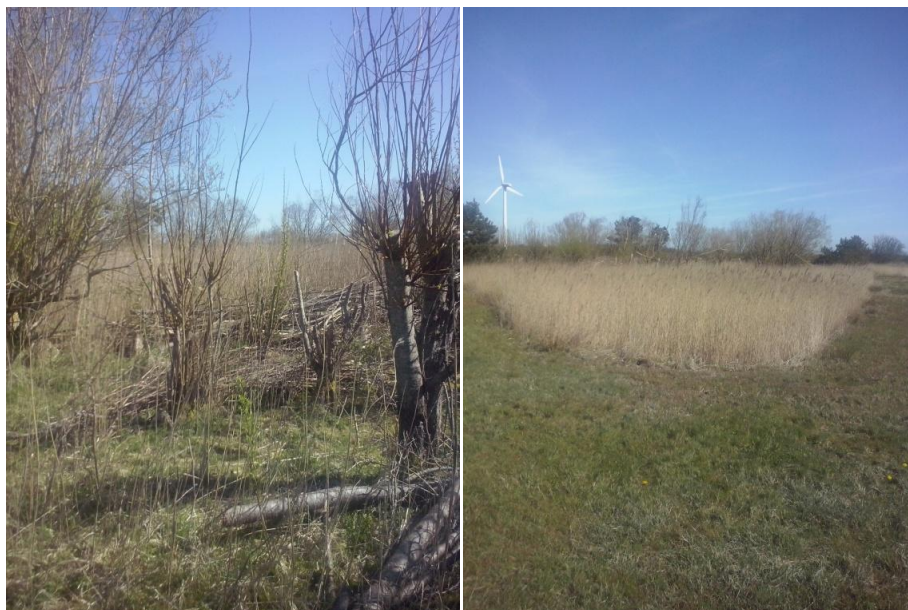
Figur 1: Vildt-pleje tiltag på mark 10-0. Bag træer og tagrør på det første billede, er der en sø.

Esben har nogle arealer der er udpeget som beskyttet efter naturbeskyttelseslovens §3. Af disse ligger mark 10-0 og 8-1b ned til Limfjorden, og i et område med jagtinteresser. Mark 10-0 er gjort velegnet til jagt, ved at lave en variation mellem høj og lav vegetation, samt træer og buske hvor vildtet kan skjule sig samt finde føde. Vildplejen på mark 8-1b kunne forbedres ved at etablere læhegn med minimum 3 rækker og bestående af hovedsagligt løvtræer og buske, der er i området. Dette vil give skjulesteder for vildtet, samt føde for både vildtet og fugle. Desuden kan Esben med fordel slå græsset første gang sidst i juli, først i august, for at fuglene er færdige med at ruge og haren har et skjulested. Ved at lave striber på arealet, ligesom på mark 10-0, vil der være gode føde-muligheder samt områder hvor unger af forskellige dyr kan tørre.